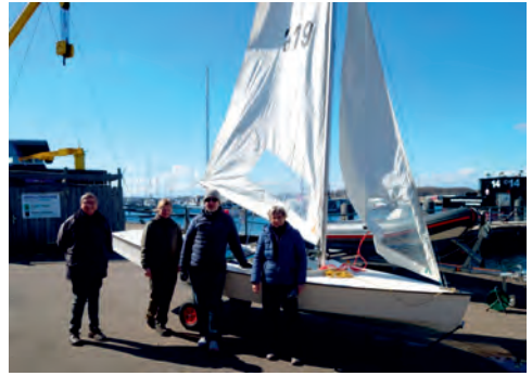
Die erste Pirat-Jolle war schon mal segelfertig und