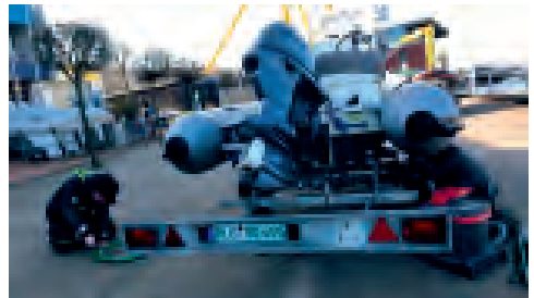
Bei allen Schlauchbooten musste der Unterwasseranstrich erneuert werden.

Bevor die vereinseigenen Wasserlieger abgelippt und die Jollen aufgeriggt werden konnten, war Anfang April noch einiges an Vorarbeiten zu erledigen. Die Riggs wurden einem Sicherheits-Check unterzogen und bei den Motorbooten die Funktionalität überprüft sowie die Unterwasseranstriche erneuert. Außerdem mussten noch kleinere GFK-Arbeiten durchgeführt werden. Für die Vereinsboote