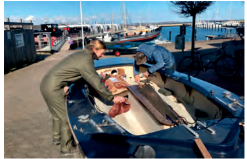
bei der zweiten Pirat-Jolle mussten vor dem Aufzügen noch einige handwerkliche Arbeiten erledigt werden.