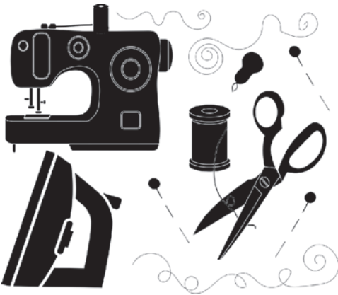
Foto Nähen sw

im April und Mai 2022 beginnen, gerade im Sport- und Bewegungsbereich, unsere Folgekurse. Es lohnt sich, unter www.vhs-laboe.de die entsprechenden Folgekurse im Internet anzusehen und noch einen freien Platz in dem einen oder anderen Kurs zu ergattern.